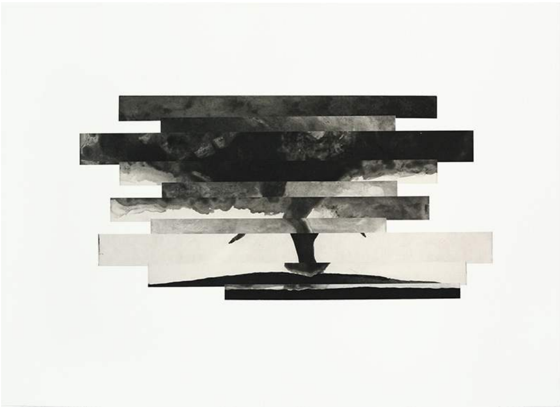
Tornades , lavis à l'acide sur cuivre, 70 x 50 cm; 2017