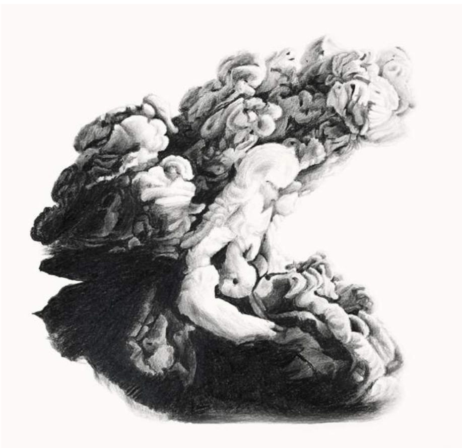
Atomiques , dessin, format variables, 2016