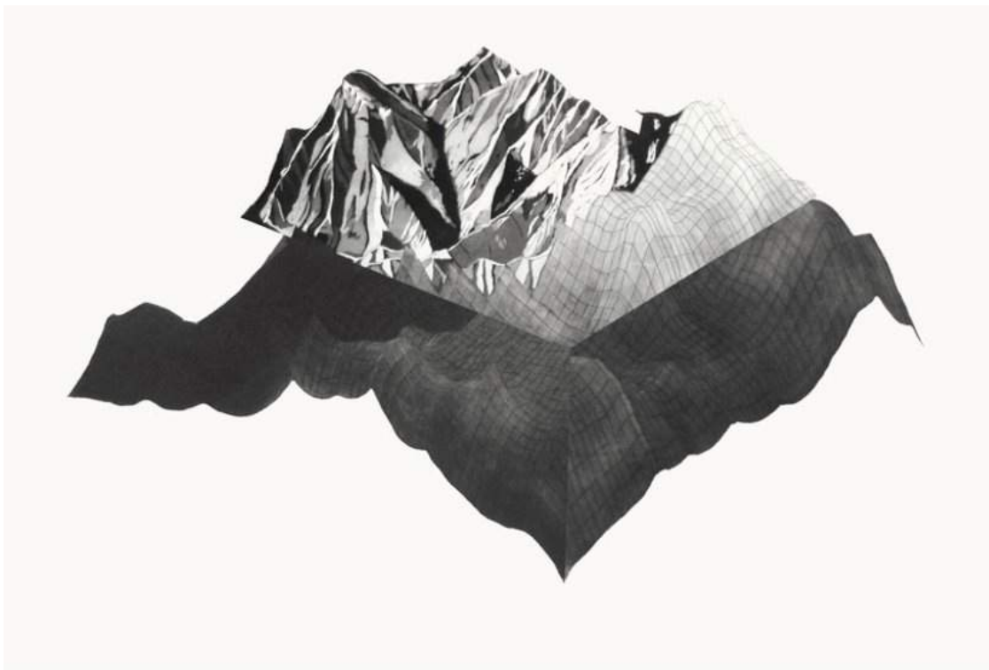
Badlands , gravure, 60 x 80 cm, 2014

« Un tas de gravats déversé au hasard : le plus bel ordre du monde. » Héraclite